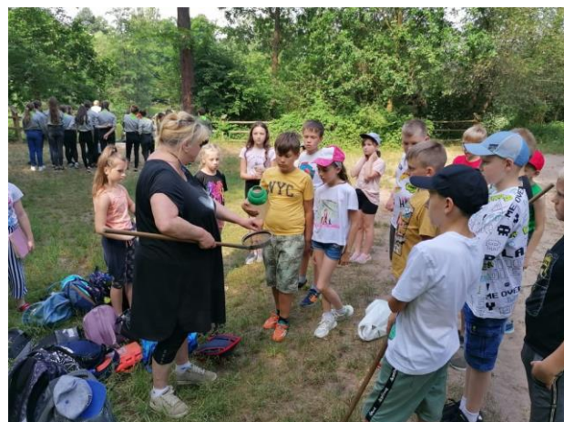
Warsztaty Woda źródłem życia