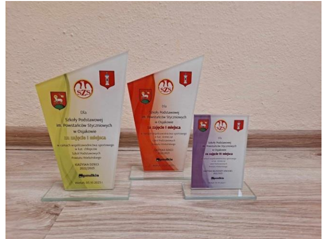
Podsumowanie rywalizacji sportowej szkół powiatu wieluńskiego

Szkoła Podstawowa im. Powstańców Styczniowych w Osjakowie stawia nie tylko na rozwój intelektualny uczniów. Daje im również możliwość wszechstronnego rozwoju poprzez udział w wolontariacie, który w naszej szkole realizowany jest w ramach Szkolnego Koła Wolontariusza. Brałiśmy udział w następujących akcjach: zbiórkach żywności, zbiórkach karmy dla zwierząt, kwestach ulicznych na rzecz Polskiego Czerwonego Krzyża, warsztatach z pierwszej pomocy, pomagaliśmy rodzinom z Ukrainy, przyłączaliśmy się do akcji Szlachetna Paczka i Wielkiej Orkiestry Świątecznej Pomocy, organizowaliśmy spotkania z mieszkańcami Domu Pomocy Społecznej w Skrzynnie, Środowiskowego Domu Samopomocy w Kolonii Raduckiej, wychowankami Specjalnego Ośrodka Szkolno-Wychowawczego w Gromadzicach, włączaliśmy się do akcji patriotyczno-charytatywnej „Święty Mikołaj na Kresach” pod honorowym patronatem Marszałka Województwa Łódzkiego i Łódzkiego Kuratora Oświaty.