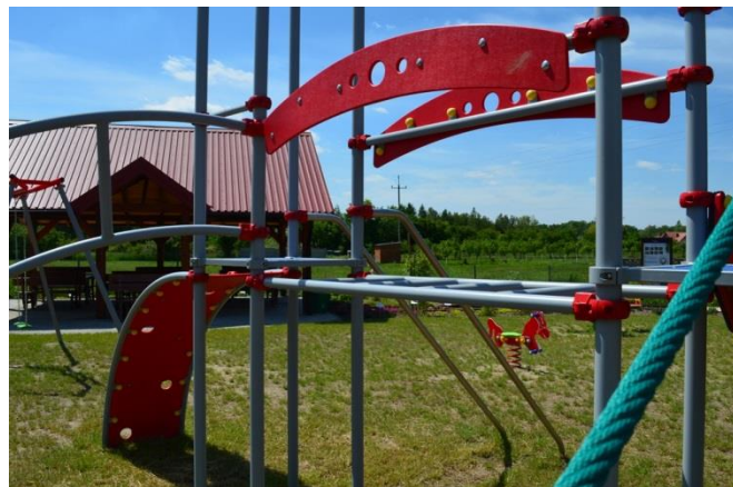
Ogród i plac zabaw przy szkole