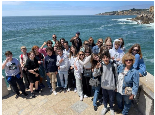
Wyjazd do Portugalii w ramach projektu Erasmus+