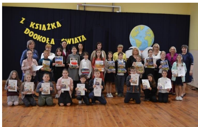
Międzypowiatowy Konkurs Czytelniczy

Udział w konkursach to zdobywanie wiedzy i doświadczenia, ale także radość ze zdobytych miejsc, np. „Finansoaktywni – Misja: Budżet. Plan do działania!”- I miejsce w ogólnopolskim konkursie pod patronatem Ministerstwa Finansów; Międzygminny Konkurs Recytatorski zorganizowany przez Gminny Ośrodek Kultury i Sportu w Białej – I, II, III miejsca uczennic, wyróżnienie; konkurs „Moje drzewo genealogiczne” organizowany przez Muzeum Ziemi Wieluńskiej - laureaci I, II, III miejsc, wyróżnienia. Nasi uczniowie zajmowali czołowe miejsca i wyróżnienia w Wojewódzkim Konkursie Plastycznym objętym honorowym patronatem Łódzkiego Kuratora Oświaty. Uczniowie naszej szkoły byli laureatami Diecezjalnych Konkursów Wiedzy Biblijnej, Międzyszkolnych Konkursów matematycznych „Liczby rządzą światem”, „Super Rachmistrz”, w Międzyszkolnych Konkursach z języka angielskiego „English Words Master”. W Międzypowiatowym Festiwalu Piosenki Patriotycznej i Pieśni Polskiej zajęli II i III miejsce.