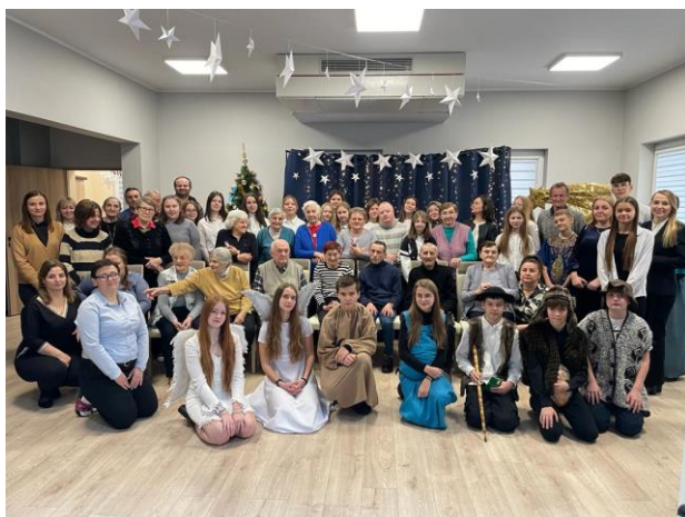
Wizyta świąteczna w ŚDS w Kolonii Raduckiej

Szkoła Podstawowa im. Powstańców Styczniowych w Osjakowie stawia nie tylko na rozwój intelektualny uczniów. Daje im również możliwość wszechstronnego rozwoju poprzez udział w wolontariacie, który w naszej szkole realizowany jest w ramach Szkolnego Koła Wolontariusza. Brałiśmy udział w następujących akcjach: zbiórkach żywności, zbiórkach karmy dla zwierząt, kwestach ulicznych na rzecz Polskiego Czerwonego Krzyża, warsztatach z pierwszej pomocy, pomagaliśmy rodzinom z Ukrainy, przyłączaliśmy się do akcji Szlachetna Paczka i Wielkiej Orkiestry Świątecznej Pomocy, organizowaliśmy spotkania z mieszkańcami Domu Pomocy Społecznej w Skrzynnie, Środowiskowego Domu Samopomocy w Kolonii Raduckiej, wychowankami Specjalnego Ośrodka Szkolno-Wychowawczego w Gromadzicach, włączaliśmy się do akcji patriotyczno-charytatywnej „Święty Mikołaj na Kresach” pod honorowym patronatem Marszałka Województwa Łódzkiego i Łódzkiego Kuratora Oświaty.