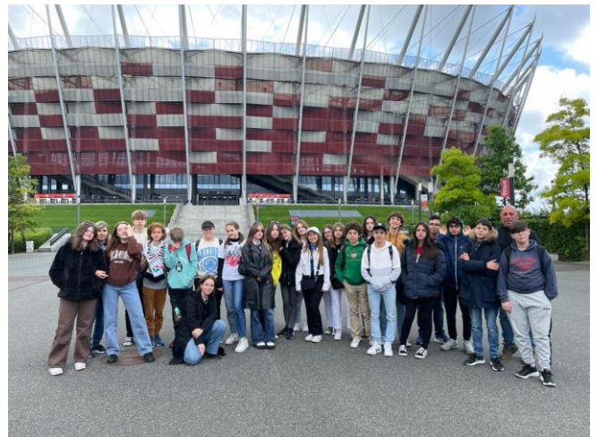
Wizyta uczniów i nauczycieli z Portugalii w naszej szkole w ramach projektu Erasmus+