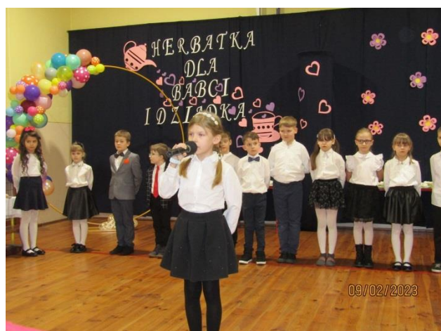
Dzień Babci i Dziadka