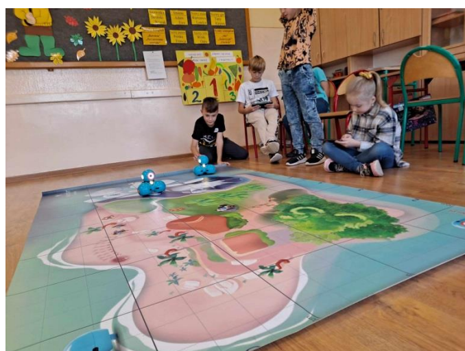
Zajęcia z robotami