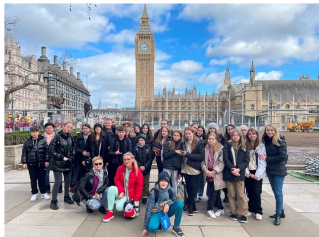
Wycieczka do Londynu

Wszystkie powyższe aspekty działalności szkoły nie byłyby jednak możliwe, gdyby nie szereg inwestycji i projektów dzięki, którym z zewnętrznych źródeł pozyskano środki, których wartość liczona jest w milionach złotych. Najważniejsze projekty zrealizowane w ostatnim pięcioleciu to: