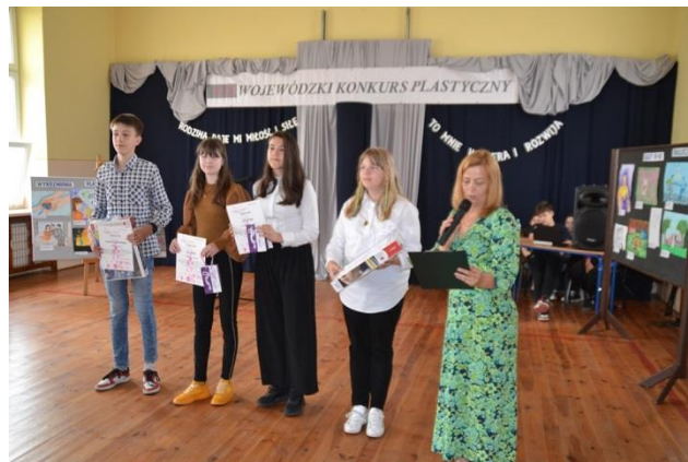
Wojewódzki Konkurs Plastyczny