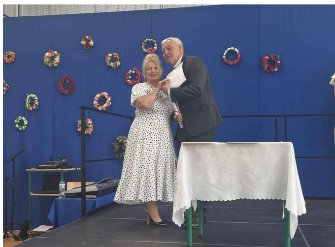
Podsumowanie akcji „Święty Mikołaj na Kresach”