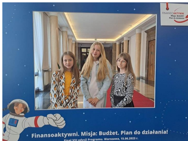
Finansoaktywni – Misja: Budżet. Plan do działania!