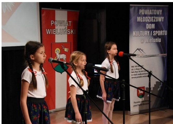
Międzypowiatowy Festiwal Piosenki Patriotycznej