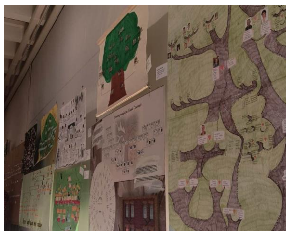
Konkurs „Moje drzewo genealogiczne”

Pisząc o współzawodnictwie nie sposób nie wymienić osiągnięć szkoły na polu sportowym, gdzie uczniowie zdobywali systematycznie czołowe lokaty w niemalże w każdej dyscyplinie bez względu na rangę rozgrywanych zawodów. Do najważniejszych osiągnięć sportowych w randze województwa i powiatu w minionym pięcioleciu należy zaliczyć: