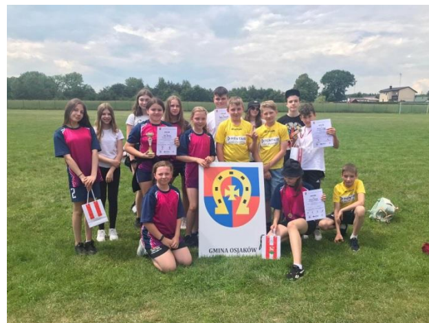
Sportowe sukcesy uczniów Szkoły Podstawowej w Osjakowie