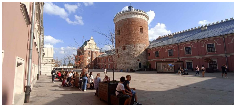
Wycieczka w ramach projektu Poznaj Polskę