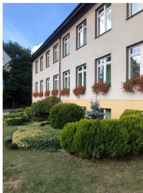
Budynki szkoły przy ul. Częstochowskiej i przy ul. Wieluńskiej

Infrastruktura, która służy efektywnej nauce młodzieży, staraniem władz samorządowych oraz dyrekcji, jest nieustannie modernizowana i unowocześniana tak, aby sprostać wyzwaniom, jakie przed edukacją stawia świat XXI wieku. Jednakże szkoła to nie tylko budynki, nowoczesne pracownie i całe zaplecze dydaktyczne, ale przede wszystkim ludzie, którzy ją tworzą. Lata 2018-2023 w historii Szkoły Podstawowej im. Powstańców Styczniowych w Osjakowie cechuje niezwykle wprost dynamizm w procesie rozwoju na różnych płaszczyznach jej działalności.