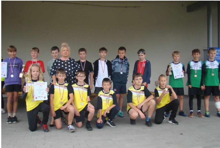
Mistrzostwa Powiatu w sztafetowych biegach przełajowych