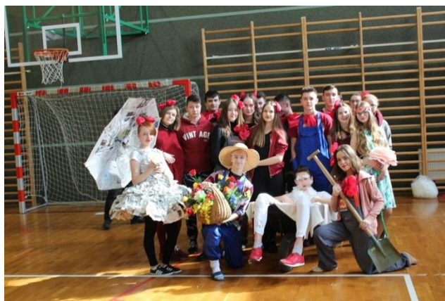
Pierwszy Dzień Wiosny