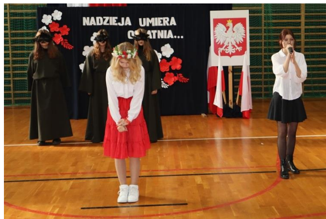
Obchody Święta Niepodległości