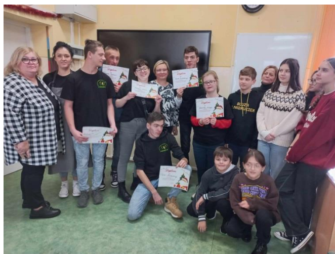
Warsztaty świąteczne z wychowankami SOSW w Gromadzicach

Ponadto uczniowie mogli rozwijać swoje pasje w trakcie wyjazdów na wycieczki krajowe i zagraniczne.