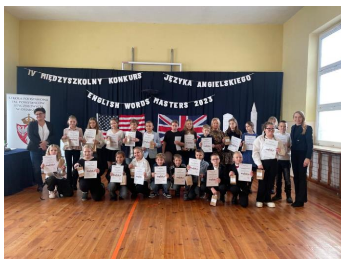
Międzyszkolny Konkurs Języka Angielskiego