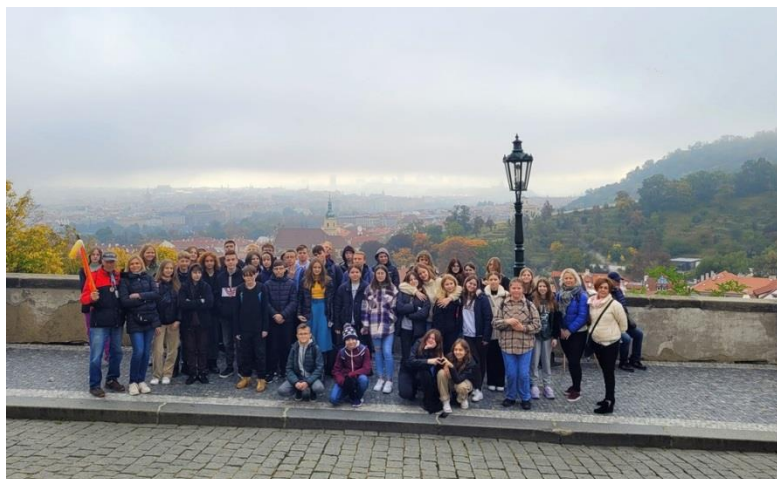
Wycieczka do Pragi

Ponadto uczniowie mogli rozwijać swoje pasje w trakcie wyjazdów na wycieczki krajowe i zagraniczne.