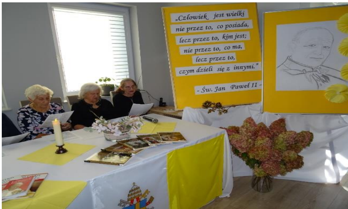
Dzień Papieski – 2023r.