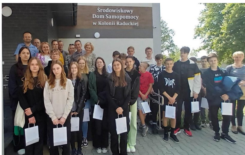
Wizyta Zespołu Szkolono –Przedszkolnego z Kraszkowic.