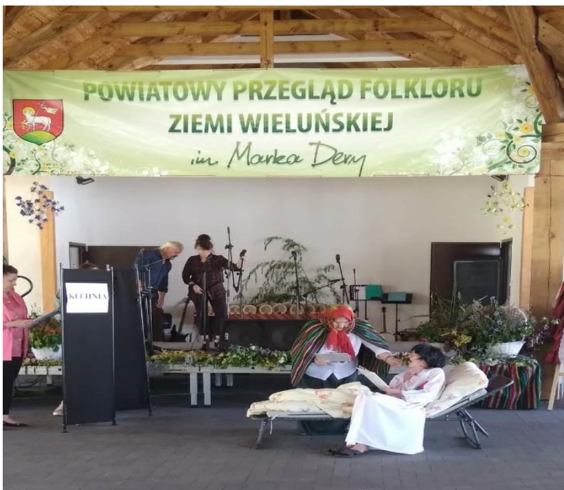
Powiatowy Przegląd Florku ziemi Wieluńskiej im Marka Dery- 2023r.