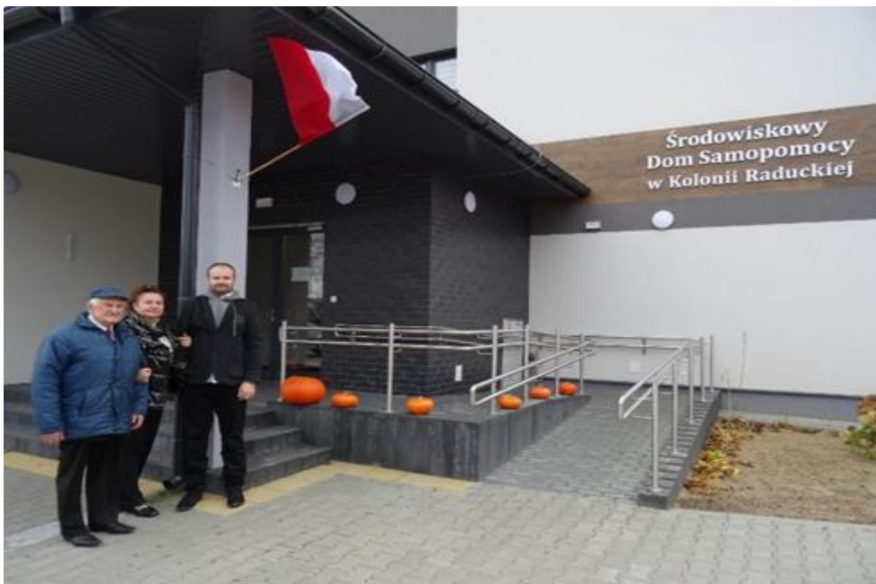
11 Listopada 2023r.