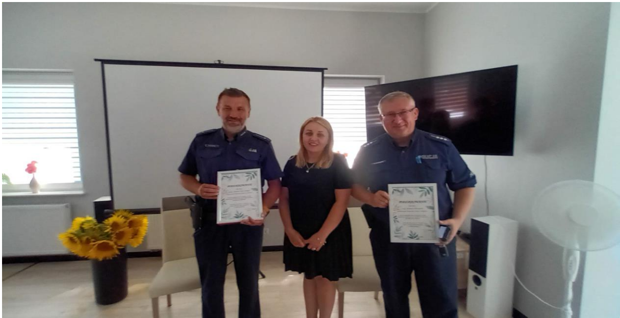
Wizyta Policjantów z Komisariat z Osjakowa- 2023r.