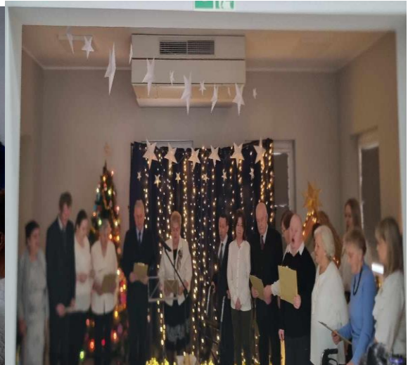
Jasełka 2022r. i 2023r.