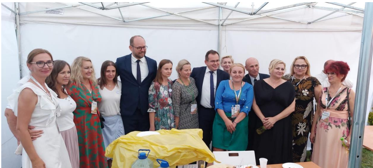
Wojewódzkie Dni Chrzanu- 2022r.

Celem współpracy Środowiskowego Domu Samopomocy z różnymi podmiotami jest integracja i kształtowanie pozytywnych relacji uczestników z najbliższym otoczeniem rodzinnym i społecznym. Dlatego też nasza współpraca wciąż się rozwija. Dzięki utrzymywaniu stałego kontaktu z opiekunami i rodzinami uczestników, zawsze służymy wsparciem i wzajemną pomocą. Współpracujemy z ośrodkami pomocy społecznej oraz Powiatowym Centrum