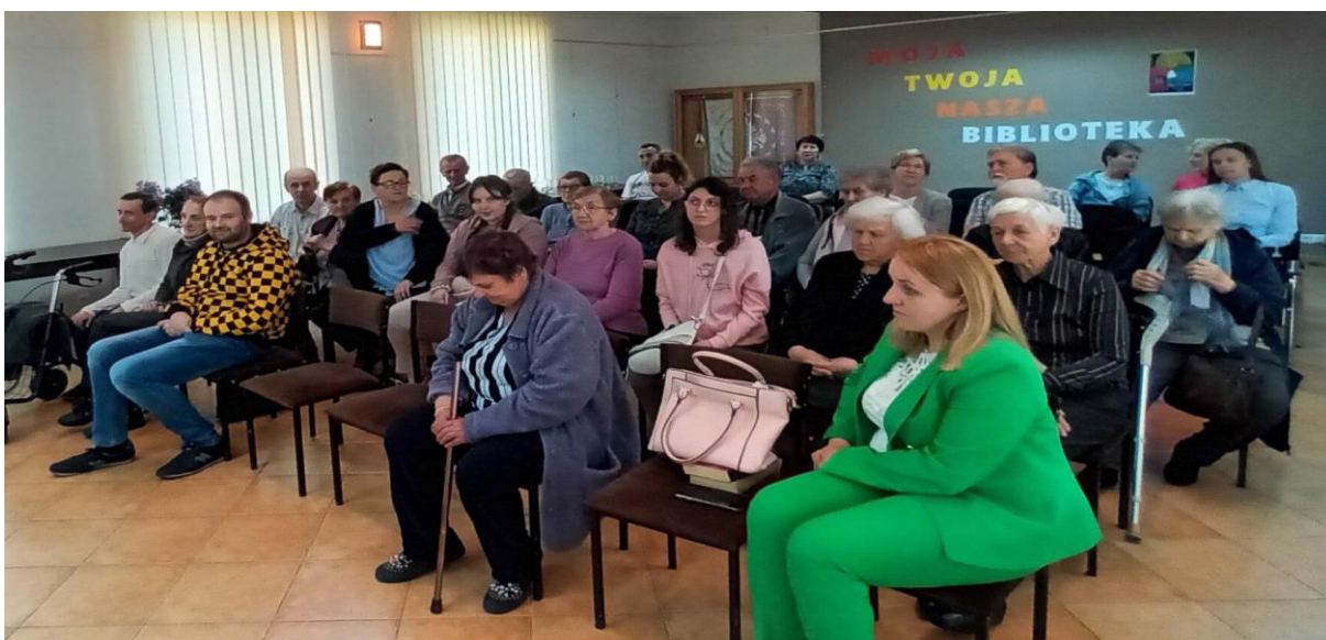
Wyjazd do Gminnej Biblioteki w Osjakowie.