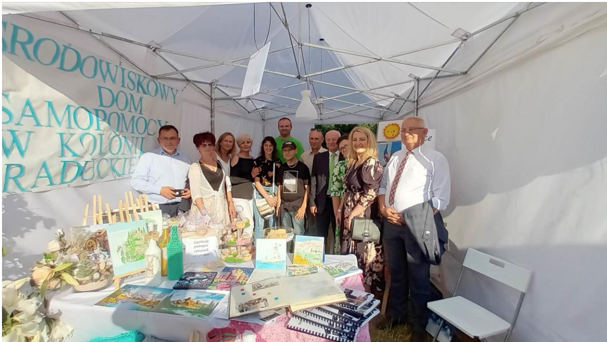
Dni Gminy Osjaków – 2022r.