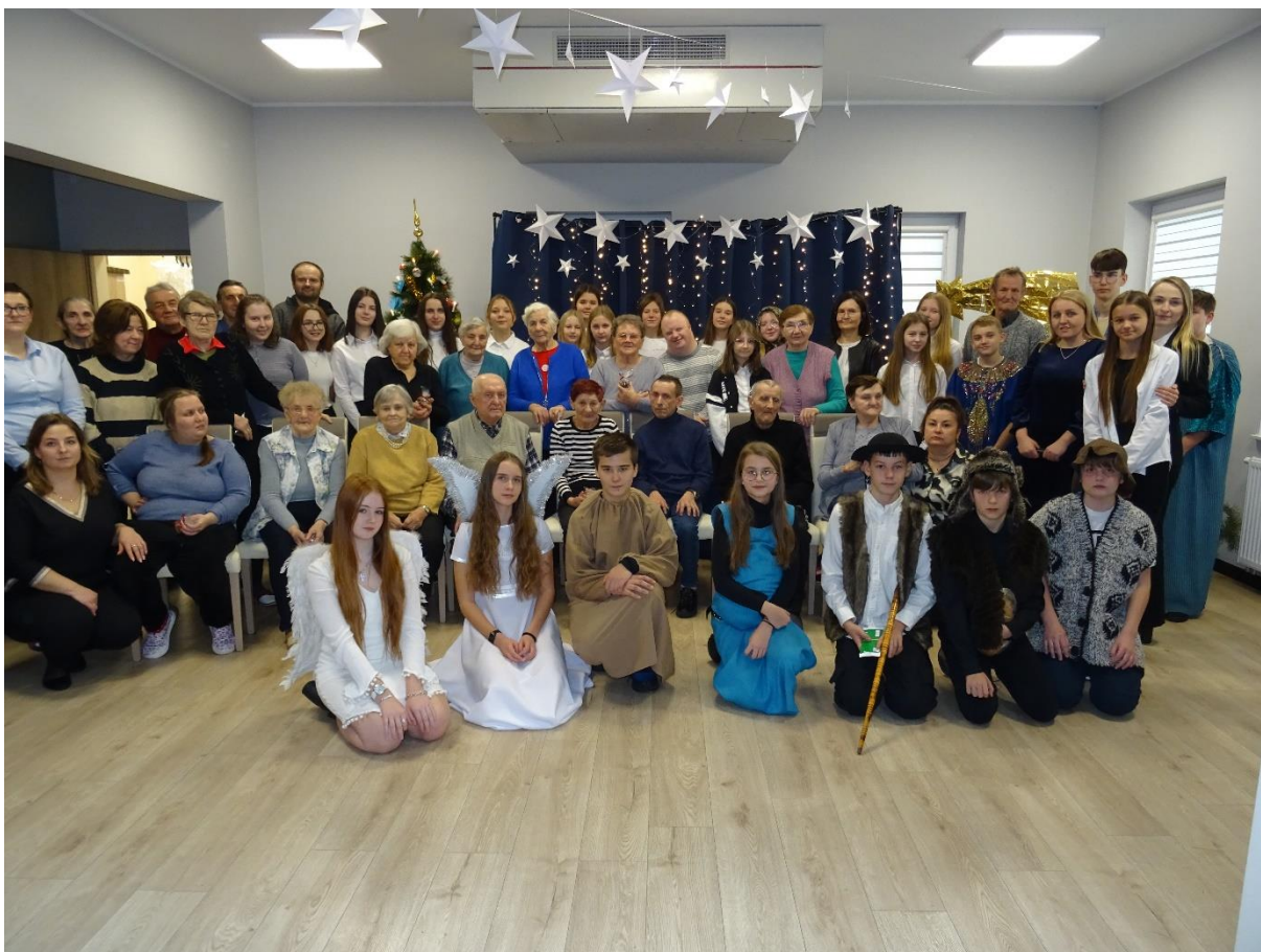
Szkoła Podstawowa im Powstańców Styczniowych w Osjakowie- 2023r